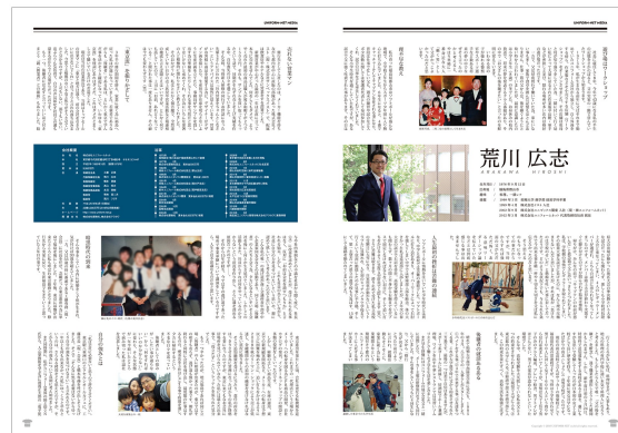
アトツギインタビュー