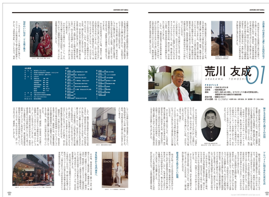
トップインタビュー