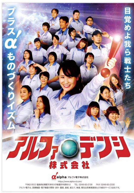
アルファ電子株式会社(企業映画化プロジェクトポスター)

仕事用ユニフォームの卸売を行う株式会社ユニフォームネットは、ユニフォームを着用したゲンバ社員を主役にした映画風ポスターの制作で、顧客企業のブランディングを支援します。