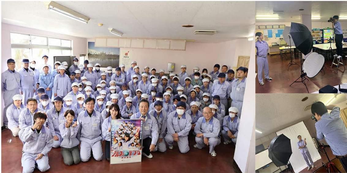
(左)集合写真 (右)撮影の様子 ※アルファ電子株式会社ではモデルチェンジの前後のユニフォームでポスターを制作予定です。写真のユニフォームはモデルチェンジ前のものになります。