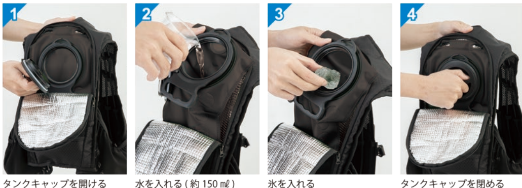
1 タンクキャップを開ける